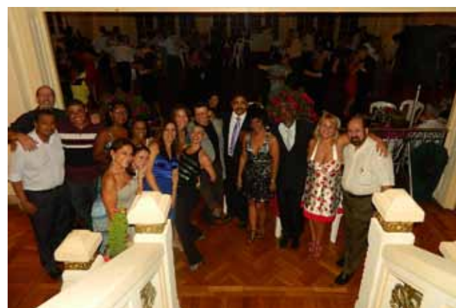
Colaboradores e salão lotado